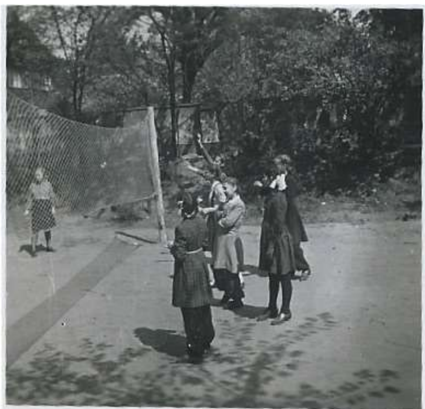
11. Спортивная площадка.