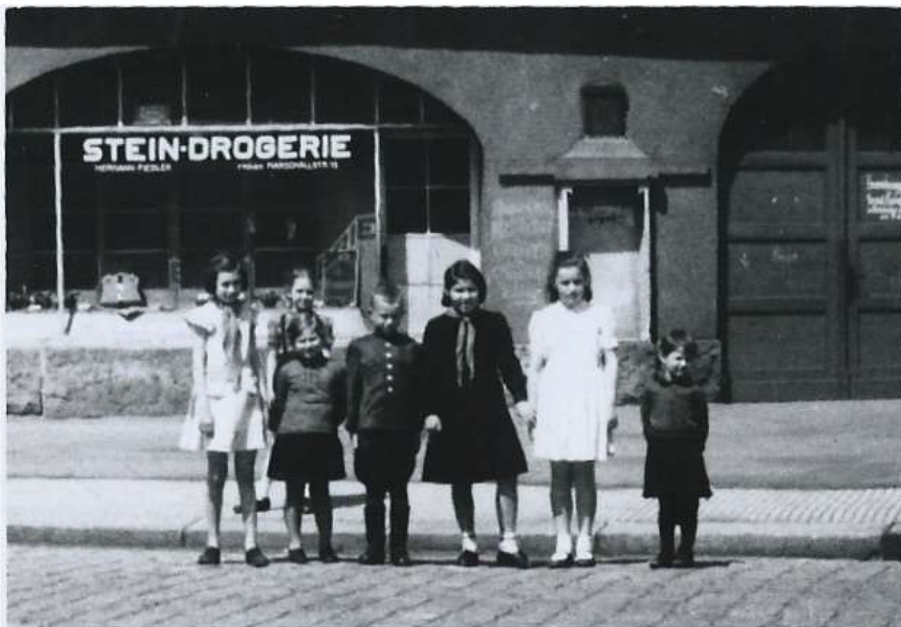
2. Советские дети направляются к месту сбора на экскурсию по Эльбе на пароходе Konigstein.