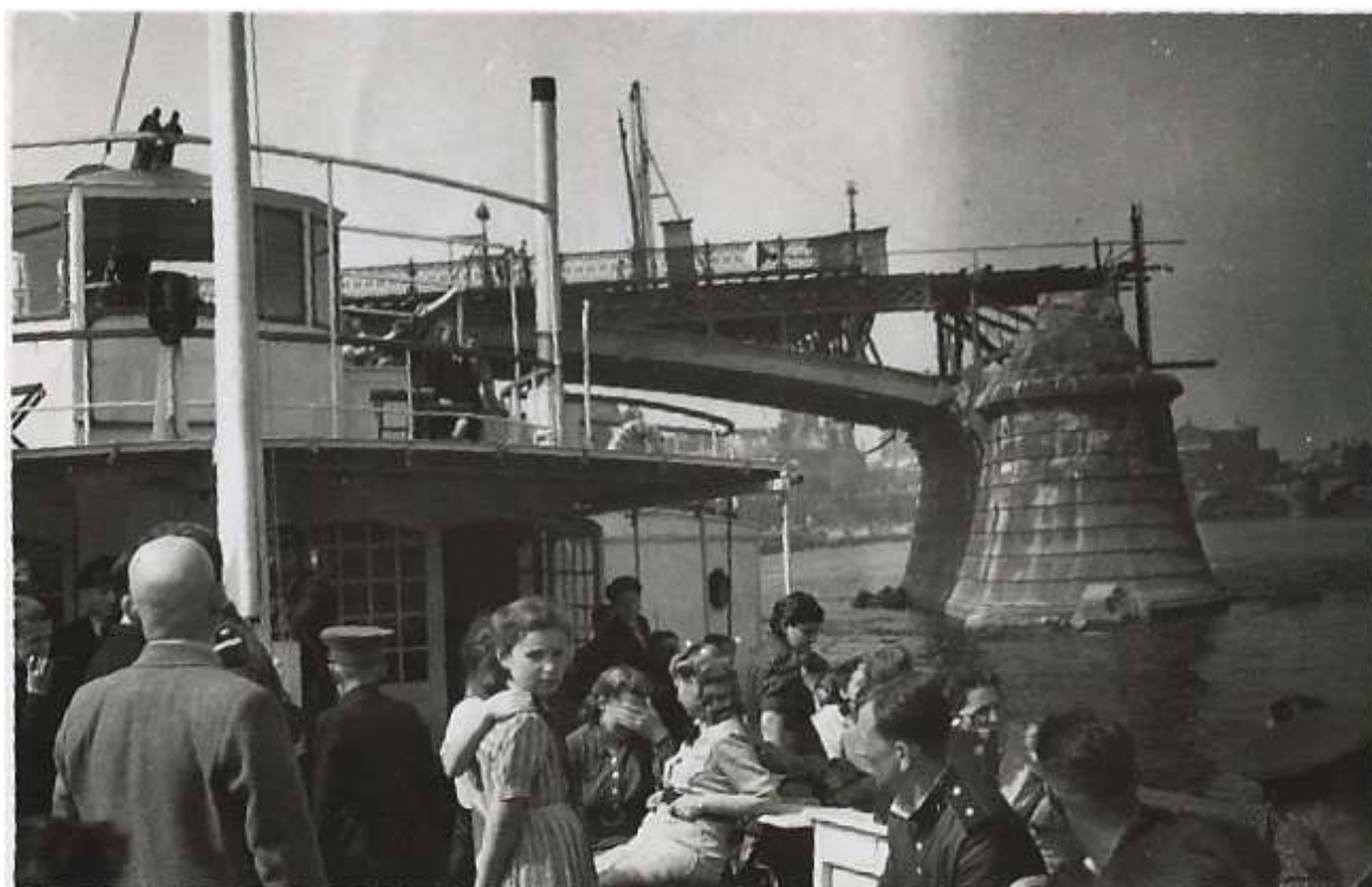
3. Берновская и Журавлёва на пароходе на фоне разрушенного моста через Эльбу