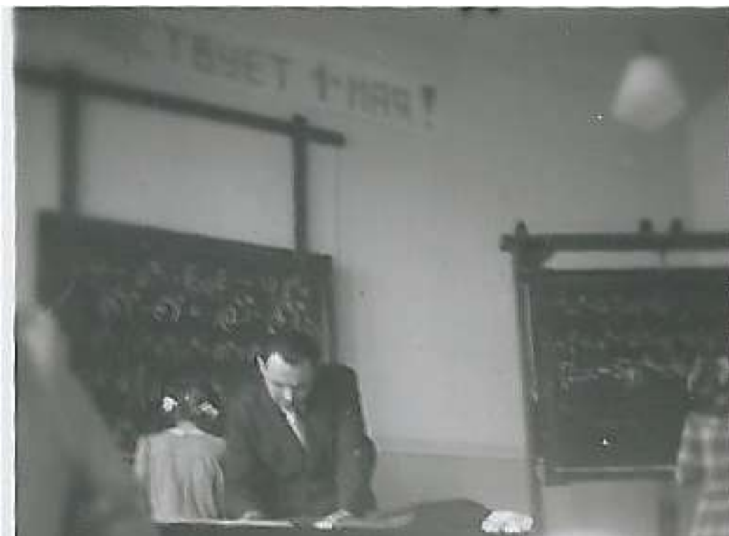
16. Математик по прозвищу «тирема».