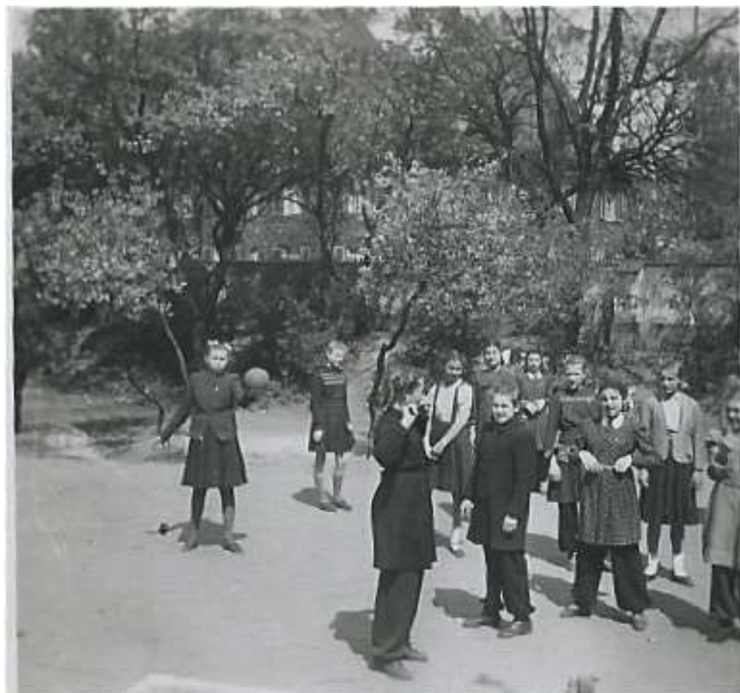
17. Урок физкультуры.