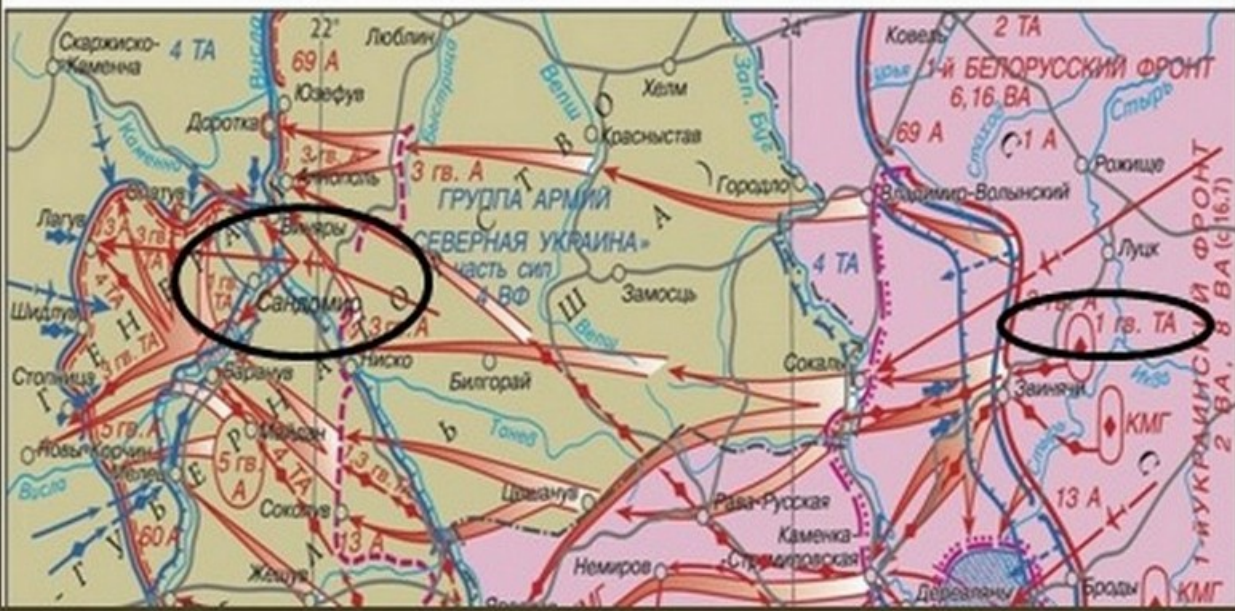
Львовско-Сандомирская операция 1944 г.