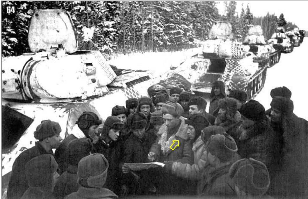
Фото 1. Экипажи танков 1-й гв. танковой бригады уточняют маршрут движения. Справа от центральной фигуры танкист очень похож на моего отца, которому В.В. Жуков приходится дядей. Только танки 1-й тб окрашивали в зимний лесной камуфляж.