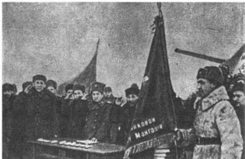
Делегация МНР вручает 44-й Гвардейской танковой бригаде знамя. Март 1944 года