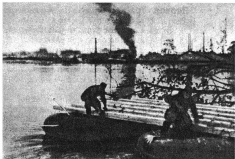
Через Шпрее. Берлин, апрель 1945 года

предстоит последний и решительный штурм Рейхстага.