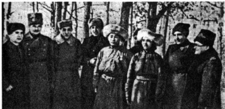
Командование 1-й Гвардейской танковой армии с гостями — посланцами трудящихся Монголии. Второй справа — М.Е. Катукوف