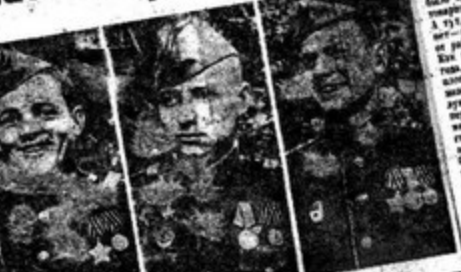
Они были на параде Победы в Москве

ЗАДУШЕВНАЯ БЕСЕДА С ДРУЗЬЯМИ Воткнись пришла с того вечера, когда в Москве проходили парады Победы. Вспоминание тех дней, когда в Москве проходили парады Победы. Вспоминание тех дней, когда в Москве проходили парады Победы.