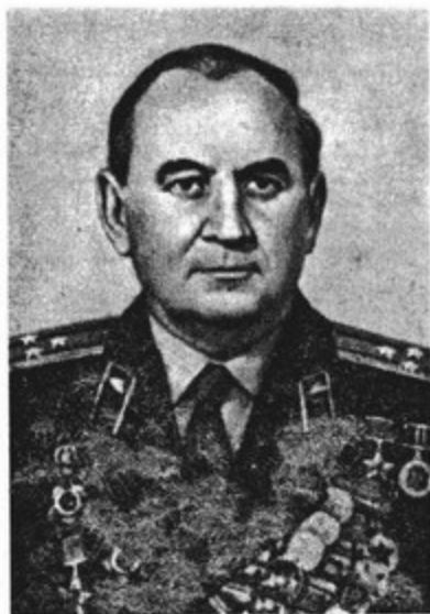
Ю. С. Соколов