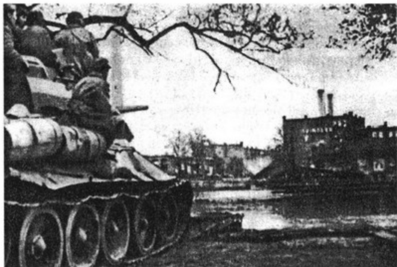
Танкисты корпуса вышли на окраины Берлина

очень широко раскрывал рот. Пинский даже рассмеялся.